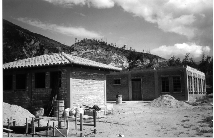
En dan nu: achteraan het centrum zelf, met voorin het sanitair blok (toegankelijk voor rolwagens) en helemaal vooraan op de foto de eerste werken aan het conciërgehuisje

Ook de vraag aan de Dienst Ontwikkelingssamenwerking op de Belgische Ambassade in Quito werd positief beantwoord: