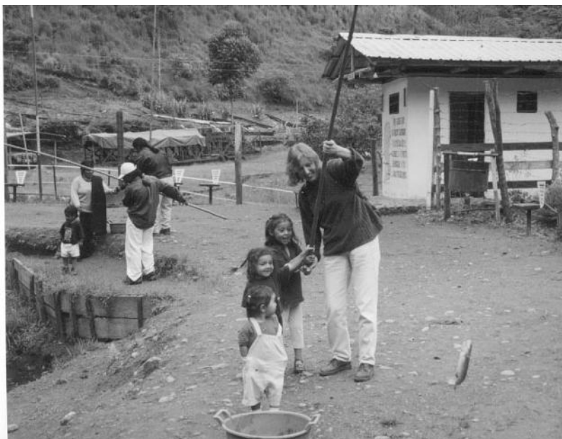
Een Zalmforel op vakantie

..., nog iets dat de moeite is om te lezen : Hebben jullie in het tijdschrift Esmeral-