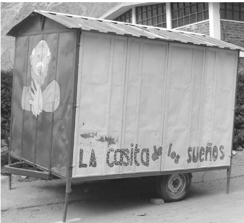
“La casita de los sueños” De rijdende bibliotheek.

Naast het begeleiden van de activiteiten in groep (bv. sport, hippotherapie, muziek, wandelen, spelletjes), probeerde ik manieren te zoeken om sommige kinderen individueel te begeleiden in het verwerven van basisvaardigheden (i.v.m. kleuren en vormen onderscheiden,