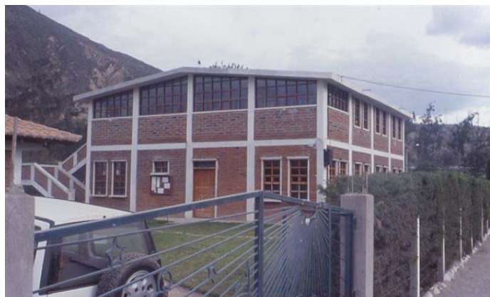
Het gebouw van Tapori

dus wel waar. 's Nachts is het erg koud maar vanmorgen was het tegen 9 uur al 24 graden! Over de middag is het snikheet en tegen rond 16 uur begint het ietwat af te koelen. Er is hier altijd wel wind, wat het toch goed draaglijk maakt. En tegen een uur of 8 's avonds heb ik al een pull nodig om buiten te voyageren. Tegen 19 u is het hier donker. Echter lang ben ik niet op, meestal lig ik tegen 21 u in bed omdat ik bekap ben. Ik span me goed in om het Spaans te leren en dat vergt toch wel wat energie. Ook al die mensen leren kennen en de conversaties volgen is vermoeiend, maar heel erg aangenaam. En de hoogte ( we zitten hier op een hoogte van ong. 2800 m) zal er ook wel voor iets tussenzitten. Ik zal het wel gewoon worden! Natuurlijk ben ik dan 's morgens bij het ochtendgloren om 5 u. wakker.