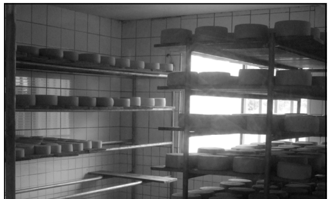
Waar de kaas rijpt