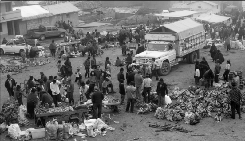
Simiatug, de markt, "triestig, koud en vuil"