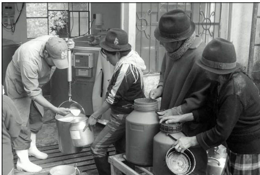
De melk wordt verdeeld