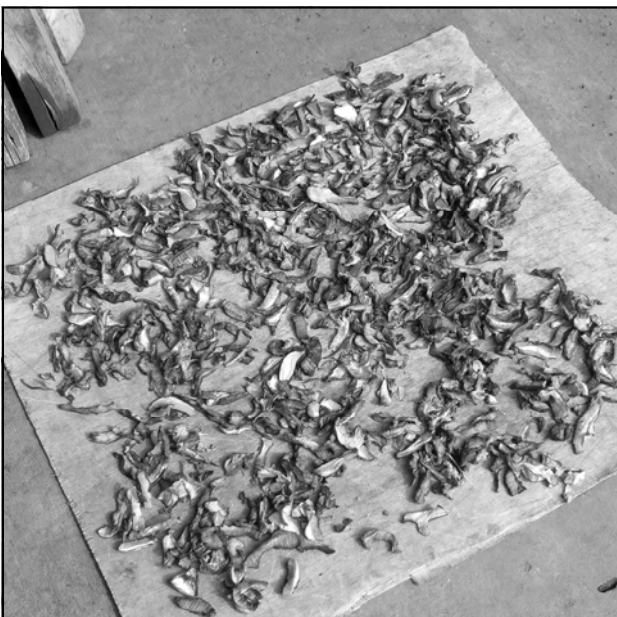
De paddestoelen worden gedroogd