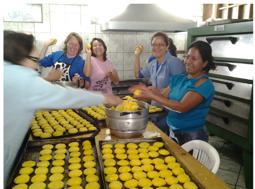
Vorbereiding van de dia de Familia