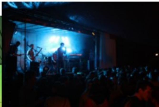
... Meer dan 12 uren live muziek