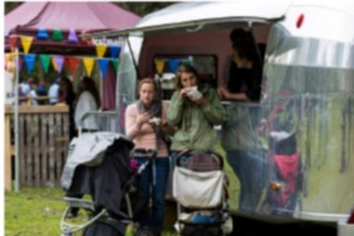
... Hapjes en drankjes, naar ieders smaak