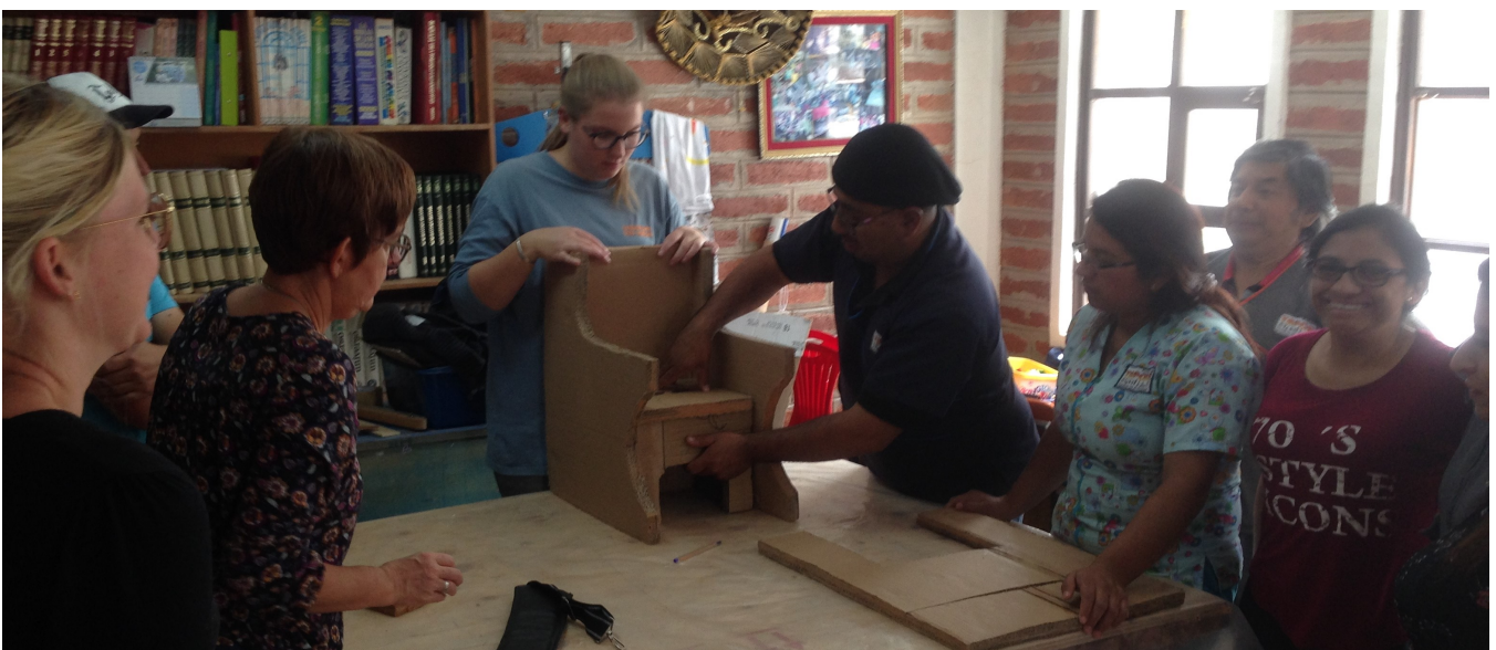
6. Vormen in elkaar passen