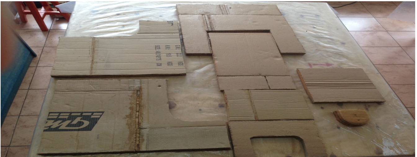
5. Vormen snijden