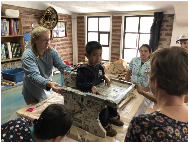
8. En deze ook