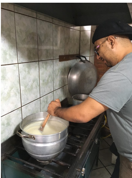
1. Engrudo maken

Bekijk de vogel ook in kleur op het web: http://users.telenet.be/koen.vaneygen1/vogel/