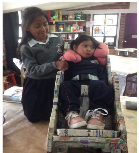
8. Even passen