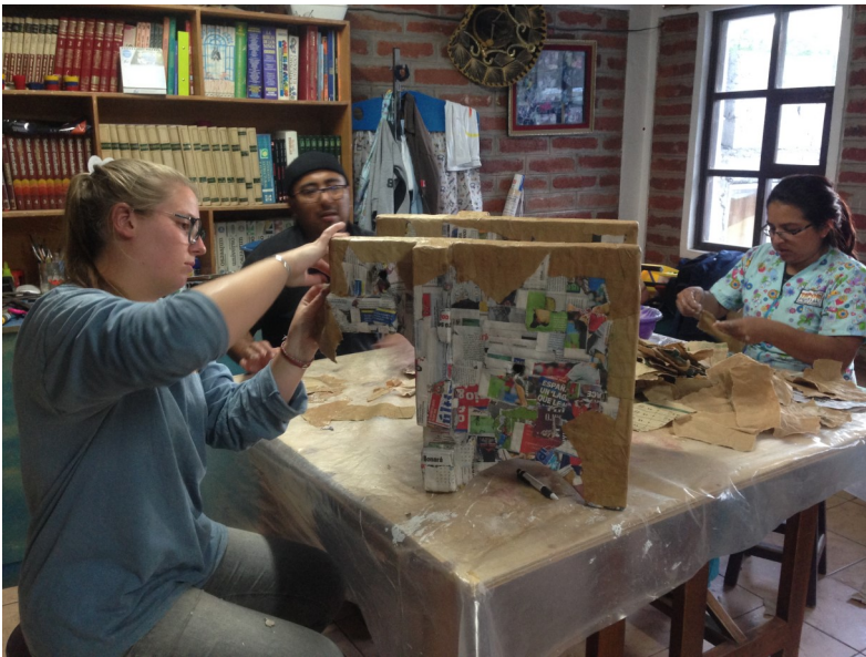
7. Model in elkaar plakken