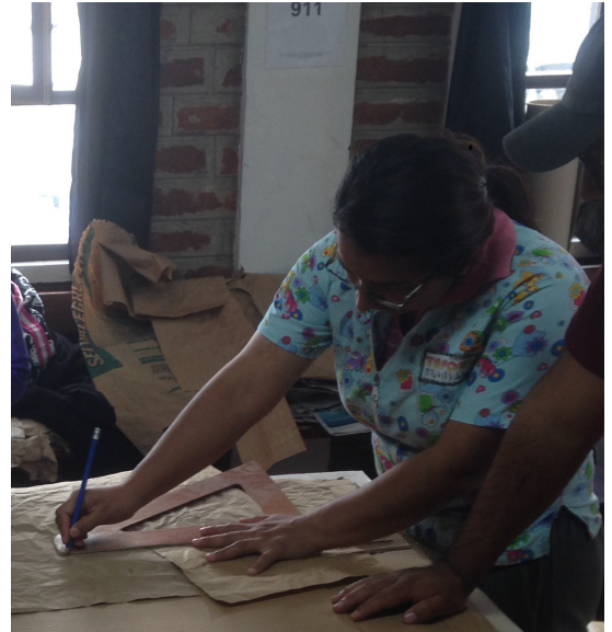
4. Patronen tekenen