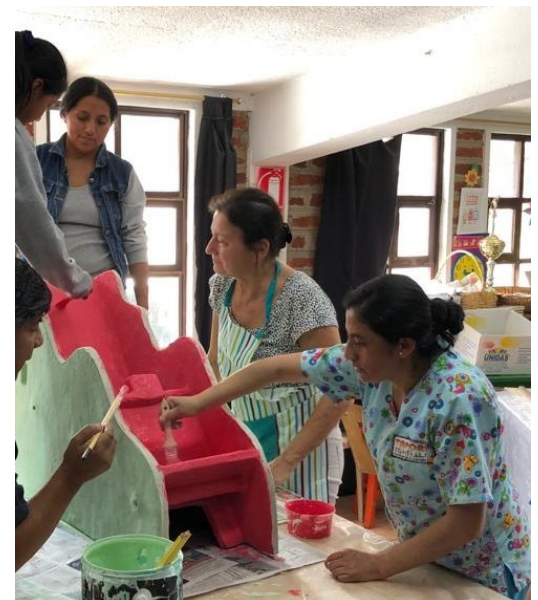
9. En dan nog een laagje verf