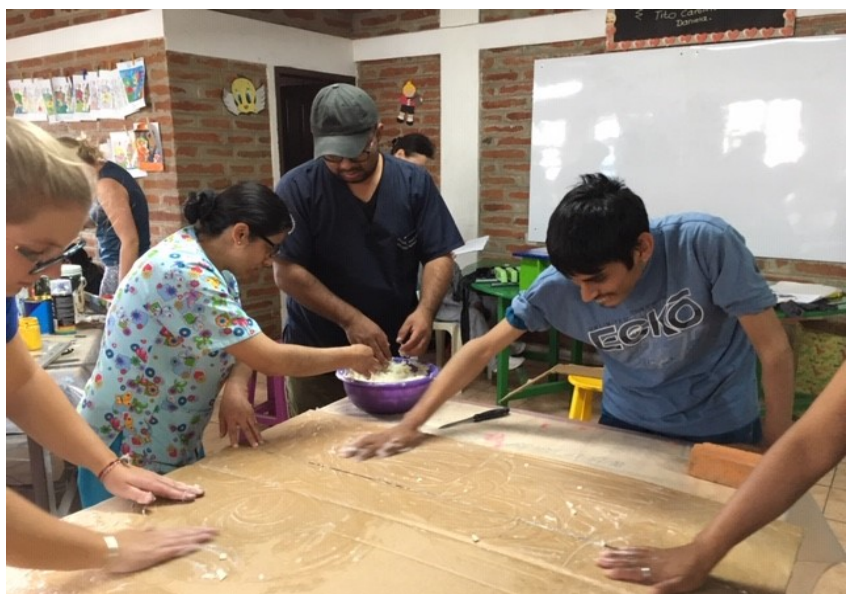
2. Platen klaarmaken