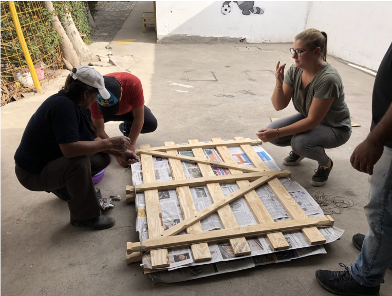
3. Platen persen en drogen